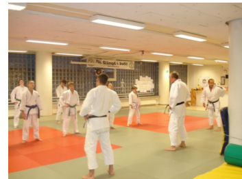
Bilder från Halloween Camp